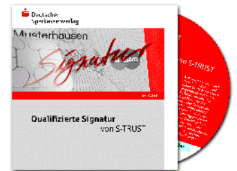
Abbildung 1: CD-ROM „Qualifizierte Signatur von S-TRUST“