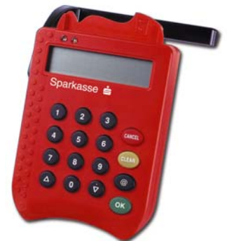
Abbildung 2: Chipkartenleser, Modell cyber Jack e-com